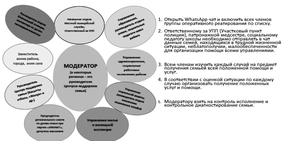
Рис.2. Алгоритм межведомственного взаимодействия членов группы оперативного реагирования по выявлению семей в ТЖС для организации помощи

Службы межведомственного взаимодействия (по примеру МОМВ в Казахстане - Алгоритм межведомственного взаимодействия членов группы оперативного реагирования по выявлению семей в ТЖС для организации помощи) (рис.2)